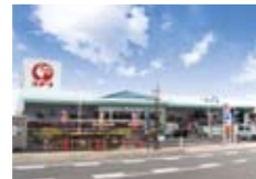
コメリ山辺店(タウン内)