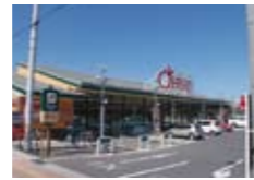
スーパーおーばん山辺店(タウン内)