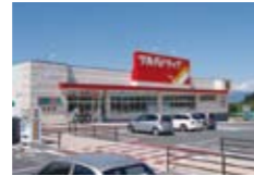
ツルハドラッグ山辺店(タウン内)